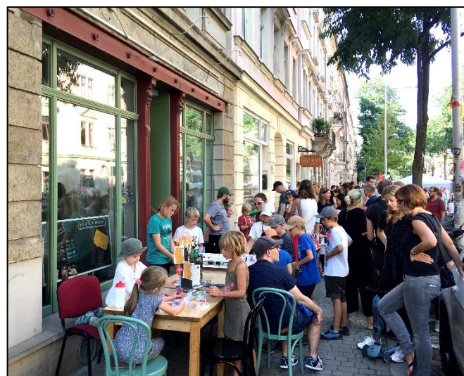
Foto: Stadtteilfest auf der Zwickauer Str.

Liebe Eltern, wenn ihr die Jugendarbeit in Dresden wichtig findet und uns unterstützen wollt, nutzt eure Bekanntschaften und Netzwerke und/oder sucht den Austausch mit Politiker*innen, damit die Förderung der offenen Kinder- und Jugendarbeit bei allem bestehenden Haushaltsdruck nicht hinten runterfällt.