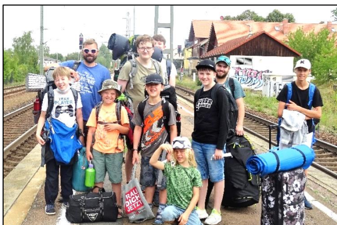
Foto: Jungenfahrt Teilnehmer bei der Rückreise

der Sommer ist so langsam vorbei. Was aber für uns noch gut in Erinnerung geblieben ist, sind die sechs Wochen Sommerferien mit den ganzen tollen Erlebnissen, die wir mit Euch haben konnten. Angefangen vom Ferienpassfest bei den Filmnächten am Elbufer, über das Schnipsen von Schokoküssen, Baden, Eis machen, Hörbücher aufnehmen, Darts spielen bis hin zu den Ferienfahrten in der letzten Ferienwoche haben alle Angebote mit euch durchweg Spaß gemacht!